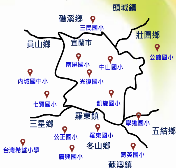
宜蘭縣大眾科學日參與國小團隊